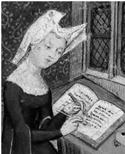
Christine de Pizan escrevendo em seu estúdio. PIZAN, Christine de. La Cité des Dames. Paris, ca. 1405. Iluminura em manuscrito. Bibliothèque nationale de France, Ms. Français 607. Disponível em: https://gallica.bnf.fr . Acesso em: 6 mar. 2026.

Em relação à realidade das mulheres no período medieval, observe as alternativas abaixo.